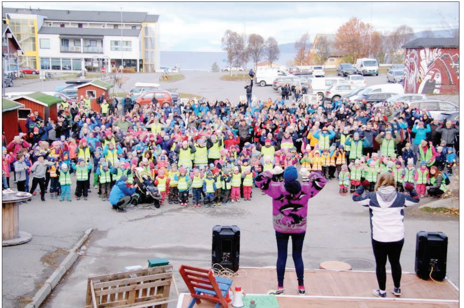
ACTION: Felles dans skapte godt humør på torget i Bossekop tirsdag.