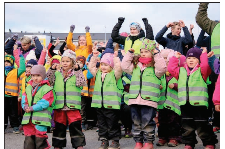
ALLE MED: Både skolebarn og barnehagebarn var tilstede under arrangementet.